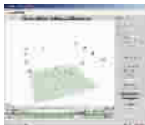
图2 确定 marker 点